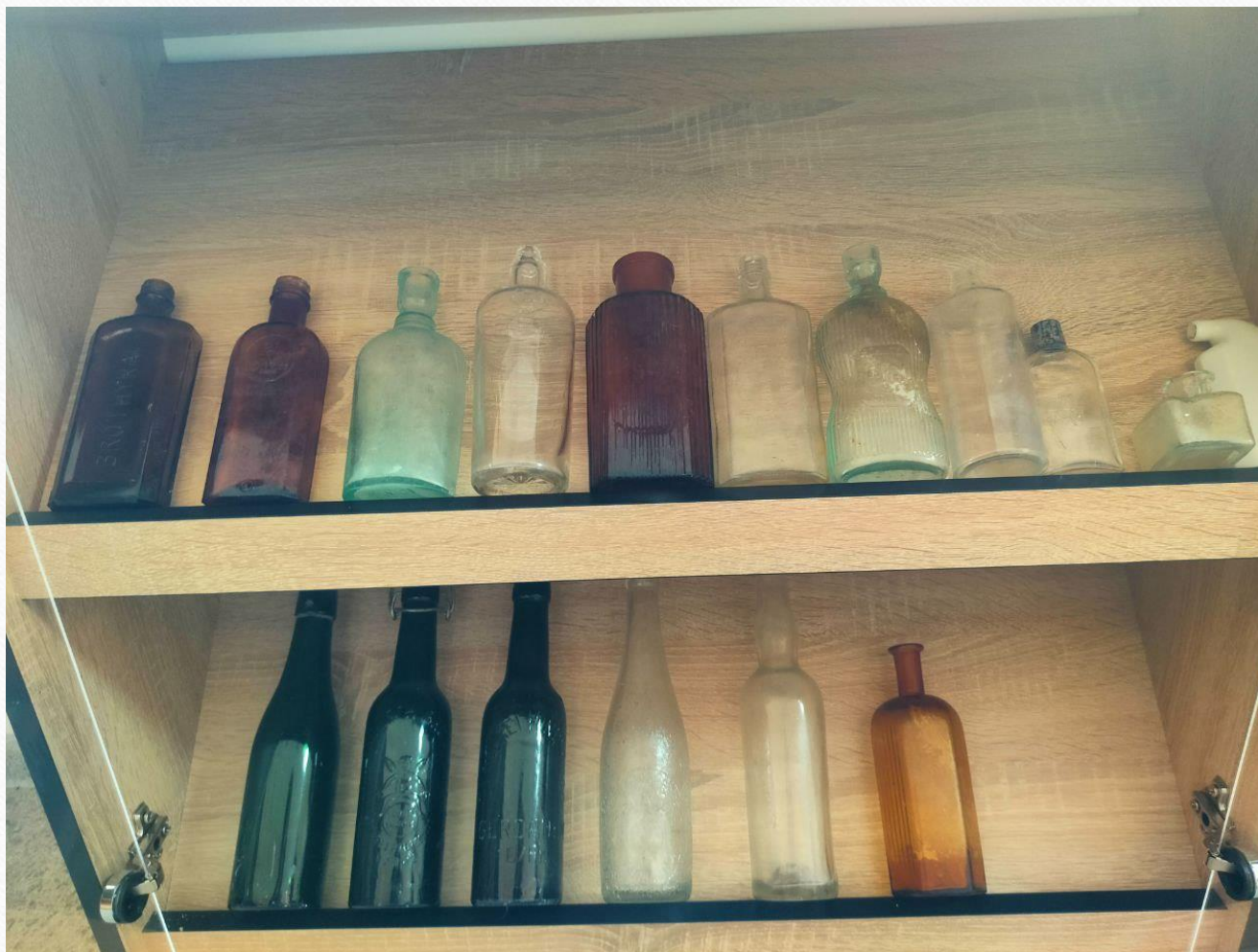
Коллекция немецких бутылок и сосудов