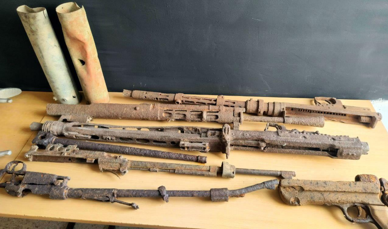
Экспонаты найдены в земле на территории Калининградской области