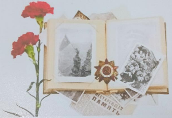
Подготовил: Джережа Ефим, ученик 8б класса